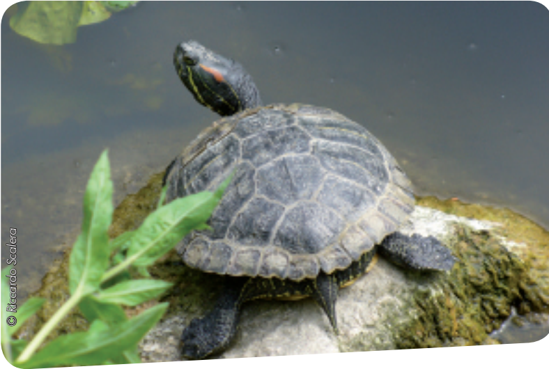
Trachemys scripta elegans

L'impact de nombreuses invasions passées aurait été bien moins grave si les Etats d'Europe avaient uniformément appliqué les meilleures pratiques et rapidement pris des dispositions pour éradiquer les espèces introduites dès leur détection. La plupart des invasions biologiques qui menacent aujourd'hui le continent auraient pu être évitées par une meilleure sensibilisation au problème des espèces exotiques envahissantes et par une plus grande détermination dans la lutte.