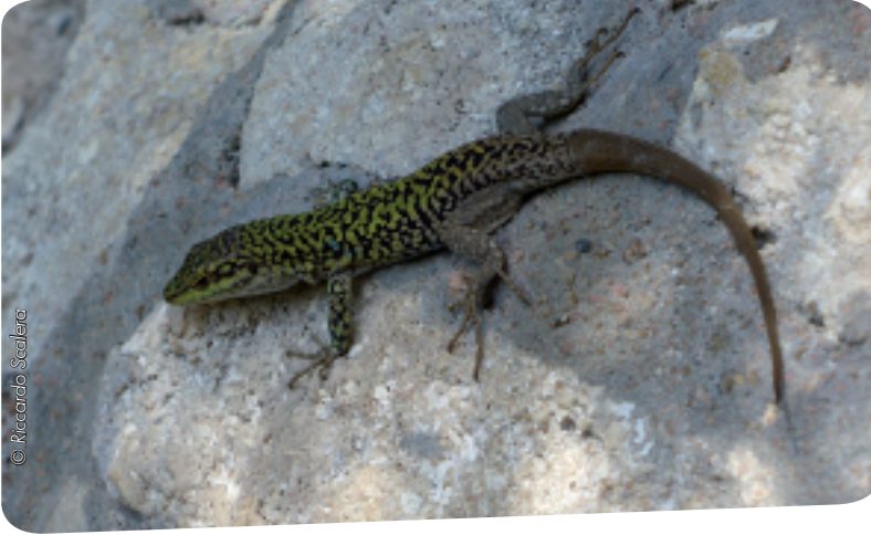
Podarcis sicula introduit dans son milieu naturel